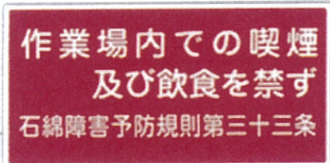
■石38-2 ■品番：CA-770 サイズ：300×600mm 素材：ラミプレート