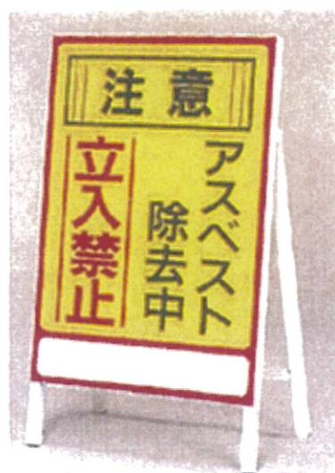
■アスベスト-1 ■品番：CA-730 サイズ：700×500mm(板面) 素材：硬質塩化ビニール +スチール枠