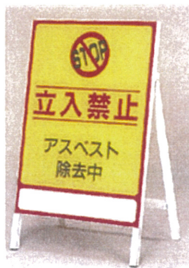
■アスベスト-2 ■品番：CA-740 サイズ：700×500mm(板面) 素材：硬質塩化ビニール +スチール枠