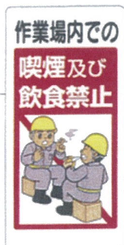
■324-53 ■品番：CA-772 サイズ：600×300mm 素材：エコユニボード (塩化ビニール)