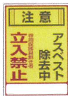
■アスベスト-3 ■品番：CA-750 サイズ：350×250mm 素材：硬質塩化ビニール