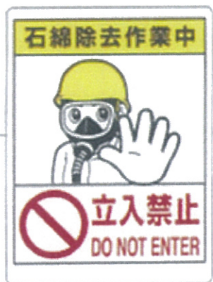
■324-51 ■品番：CA-771 サイズ：600×450mm 素材：エコユニボード (塩化ビニール)